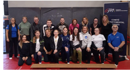
Aide animateur adultes